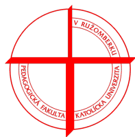
Pedagogická fakulta Katolíckej univerzity v Ružomberku