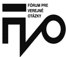
Fórum pre verejné otázky